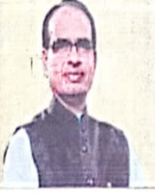
श्री शिवराज सिंह चौहान, मुख्यमंत्री